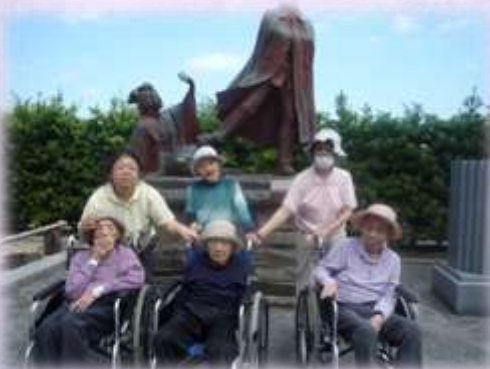
ジャカラングの お花を見におでかけ!