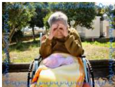
ぽかぽか陽気のこの日は、みんなで散歩をしました。