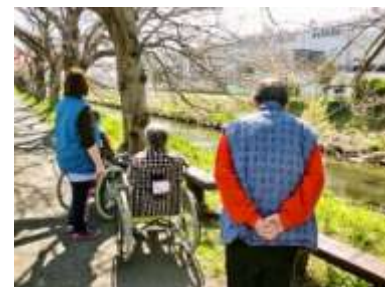
近くの桜並木へ…満開まであとチョット!