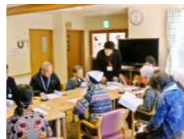
2か月に1度の運営推進会議です。地域の方や、市の職員さんが参加してくれます(^v^)