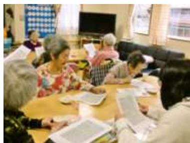
手作りのちらしずしは大好評でした(*^_^*)