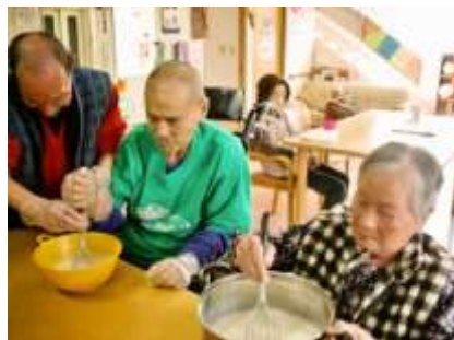
雛祭りは、みんなでデザートも作りました★