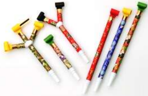
和風友禅染柄吹き戻し 20cm 3ヶ入り メーカー希望小売価格: 1,890円(税込)