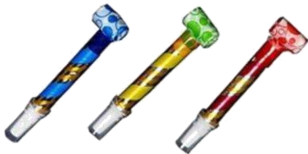
メーカー希望小売価格: 12ヶ入り 2,880円(税込)